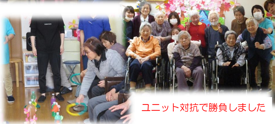
ユニット対抗で勝負しました