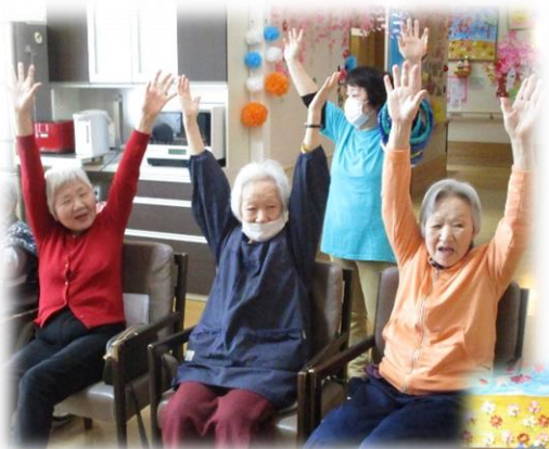
春のレクリエーション