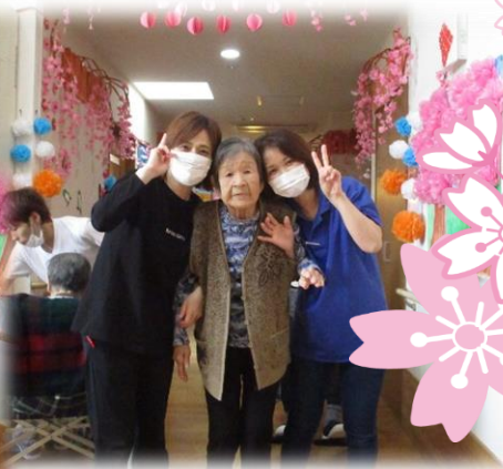
お誕生日おめでとうございます！

春の陽気とともに今年度が スタートしました。 新型コロナウイルス感染予防 対策へのご協力ありがとう ございます。 今年度もしっかりと感染予防 に努めていくとともに 入居者様と笑顔で過ごして いきたいと思ひます。